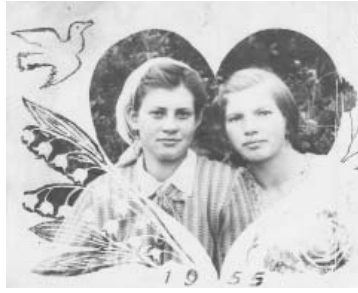
Друзья, 1 октября у Думиничского района – день рождения. В этом году ему исполняется 93 года.

Накануне праздника мы решили запустить новый проект «Родная земля: история в фотографиях». Будем публиковать старые снимки, герои которых – наш родной район и думиничане разных поколений.