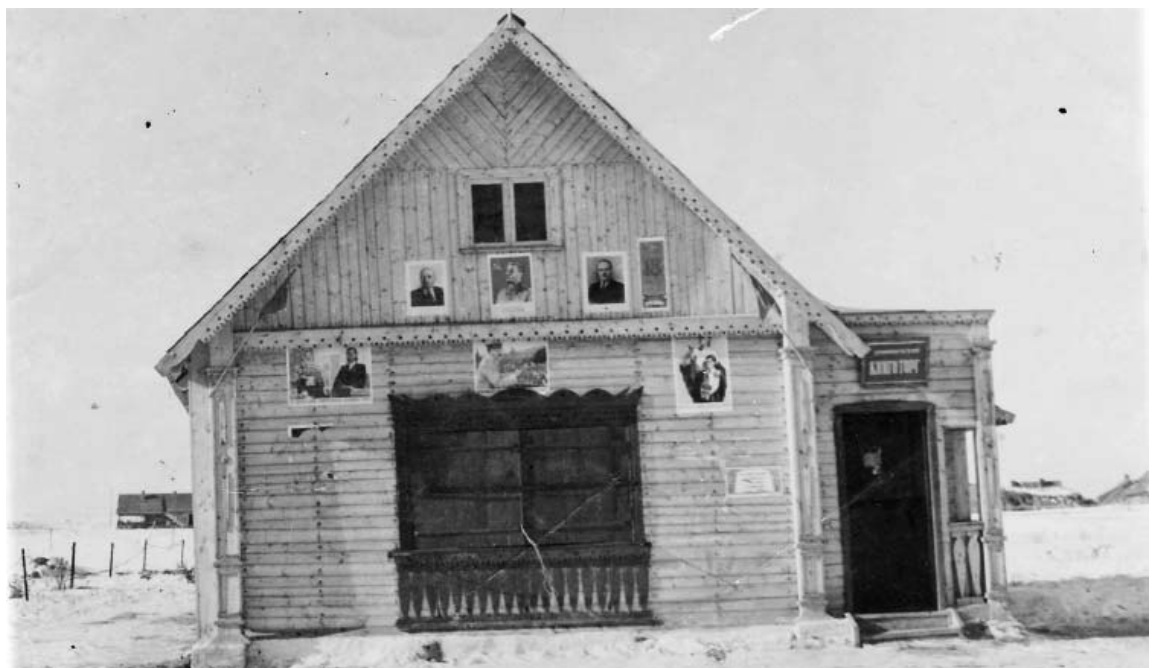
Этот магазин располагался в п.Думиничи на том месте, где сейчас находится здание администрации района. Продолжение следует.